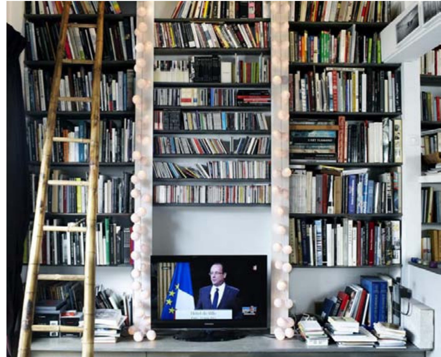
PARIS, FRANCE, 15 H 15 PAR SOPHIE ZÉNON « L'investiture du président de la République François Hollande. Son discours à la mairie de Paris. »