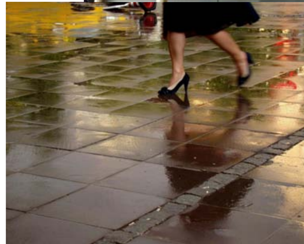
ANKARA, TURQUIE, 19 H 30 PAR TUBA KORHAN « Une élégante femme court s'abriter avant que la pluie ne ruine sa coiffure. »